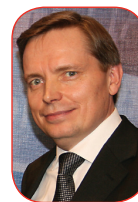
ARTUR STELE A GENERÁL KONFERENCIA EGYIK ÁLTALÁNOS ALELNÖKE, ÉS A BIBLIAKUTATÓ INTÉZET IGAZGATÓJA.