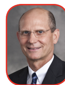
TED N. C. WILSON A HETEDNAPI ADVENTISTA EGYHÁZ ELNÖKE.