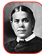
EZT AZ OLVASMÁNYT ELLEN G. WHITE: A NAGY ORVOS LÁBNYOMÁN CÍMŰ KÖNYVÉNEK 89-104. OLDALÁRÓL SZÁRMAZÓ IDÉZETEIBŐL ÁLLÍTOTTUK ÖSSZE (BUDAPEST, 2001, ADVENT TISTÁK HISZNEK ABBAN, HOGY ELLEN G. WHITE (1827–1915) NYILVÁNOS SZOLGÁLATÁNAK MINTEGY HETVEN ÉVE ALATT A PRÓFÉTASÁG BIBLIAI AJÁNDÉKÁVAL RENDELKEZETT.

Mindenki, aki semmit vissza nem tartva felajánlja magát az Úr szolgálatára, felbecsülhetetlen eredmények eléréséhez kap erőt. Isten csodálatos dolgokat fog tenni értük.